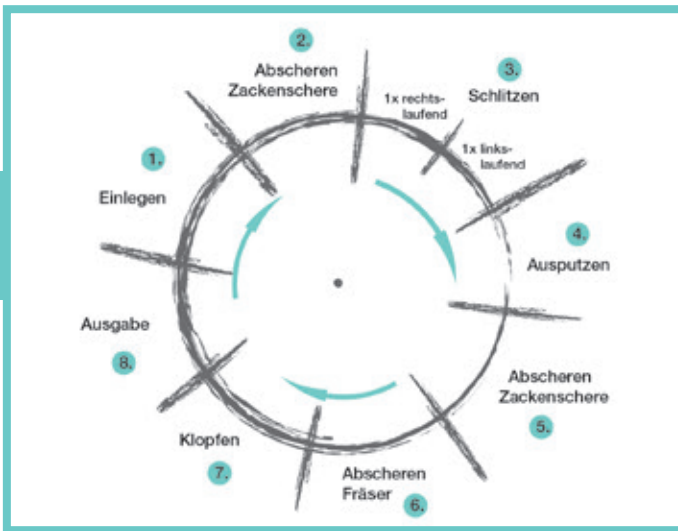
Die Bearbeitungsstationen der RP

Mit der ZAHORANSKY RP „made by GIORI“ komplettiert ZAHORANSKY das Produktspektrum im Bereich Endbearbeitungsmaschinen. Hoher Technikstandard kombiniert mit dem Service des deutschen Marktführers ergibt für Kunden ein unschlagbares Preis-Leistungs-Verhältnis.